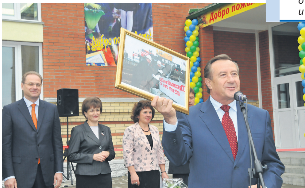
На открытии новой школы в селе Большой Изырак Маслянинского района.

Прекрасно помню, как на встрече в Маслянинской школе № 5 получил наказ — привести в порядок новое здание школы. Стены стояли уже много лет, и она не строилась. Директор мне тогда сказал: «Если этот наказ будет выполнен, тогда мы поверим, что вы — настоящий депутат».