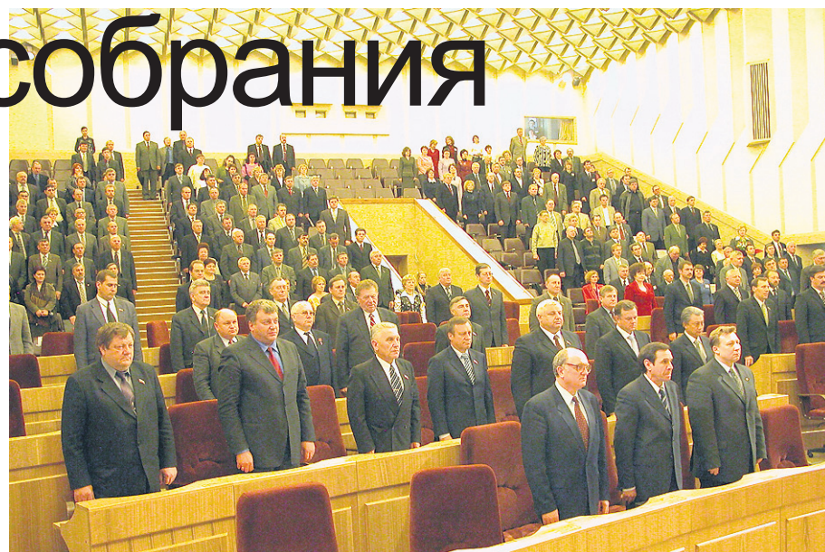
С гимна начинаются и сессии, и торжество по случаю десятилетия облсовета.