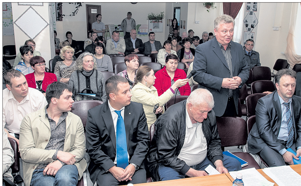
На собрании в посёлке Шахта выслушали пожелания жителей.

Что касается наиболее проблемных автомобильных дорог, по которым депутаты сами проехали, то их тоже ждут благоприятные перемены. Так, на дороге Горный — Карпысак на сегодня остаётся в плачевном состоянии