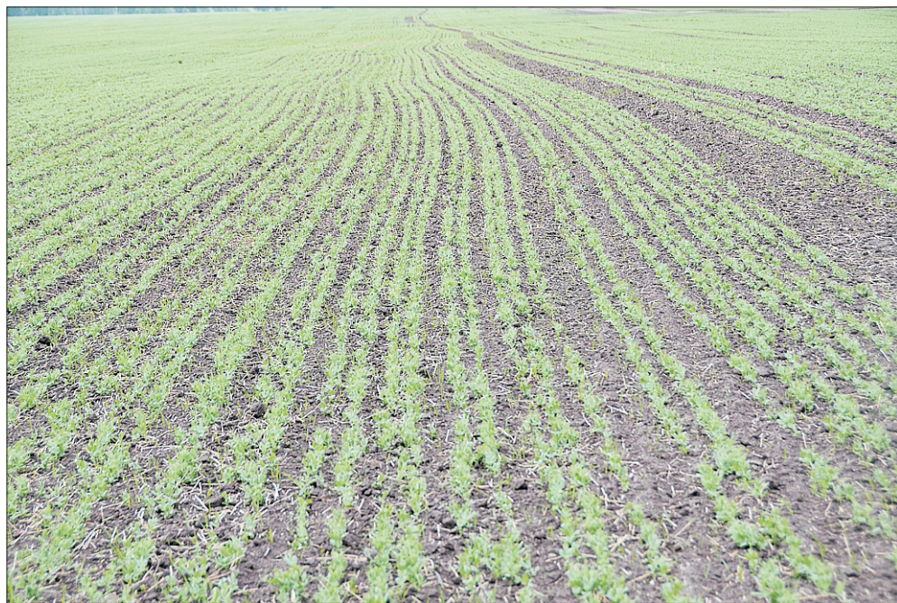
Чтобы урожай был хорошим, всходы гороха будут ещё несколько раз обрабатывать.

Он отметил, что в стратегии банка этому направлению уделяется особое внимание. Кроме того, ключевыми задачами на 2012 год являются высокие темпы роста кредитных операций, внедрение передовых практик Группы ВТБ, купившей год назад 94,87 процента акций «Банка Москвы», а также — внедрение инновационных высокотехнологичных продуктов и сервисов для обслуживания клиентов малого и среднего бизнеса в Новосибирском филиале, который, кроме Новосибирской, курирует ещё Томскую область и Алтайский край.